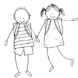
Primar- und Tagesschule Ziegelried

Als wir erfuhren, dass wir ein Brieffreundeprojekt nach Vietnam beginnen werden, freuten wir uns extrem. Wir haben sehr lange an unseren Briefen gearbeitet und haben uns viel Mühe gegeben. Wir haben unseren Namen und das Alter notiert, aber auch lange Texte über unsere Hobbies und Leidenschaften geschrieben. Auch ein Foto von uns haben wir in den Umschlag gesteckt, damit die Kinder wissen wie wir aussehen. Zum Schluss haben wir das Paket wunderschön mit einer Schneelandschaft und Palmen gestaltet und schliesslich noch etwas Schweizer Schokolade dazu gelegt.